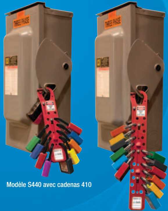
Modèle S440 avec cadenas 410